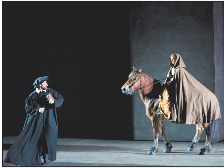
L'égérie du parti libertin poursuit un pasteur... à cheval! M VANAPPELGHEM