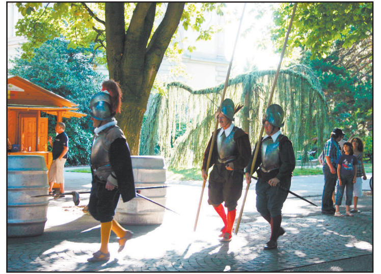
Les hallebardiers du Village huguenot.