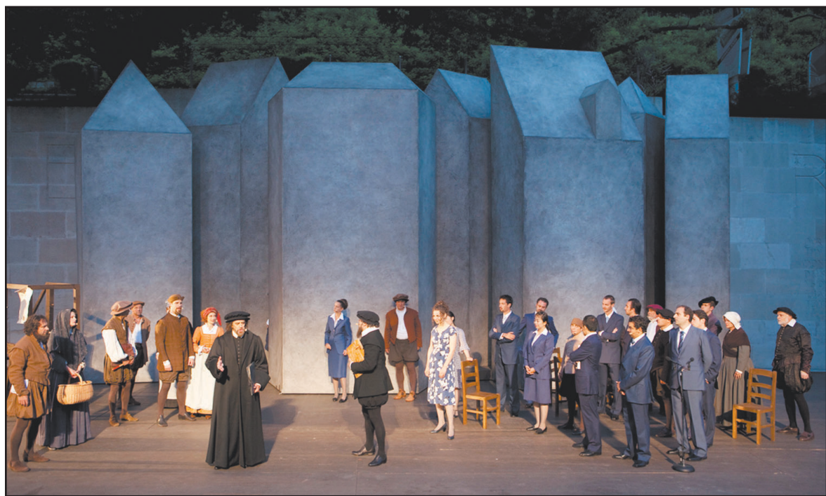
Calvin doit gérer les tensions dans sa communauté. MV

La pièce présentée en ce moment à Genève n'est pas une pièce historique. Son but est de