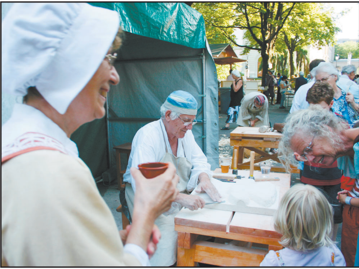
Un moment sympathique en marge du spectacle. LE NOUVELLISTE